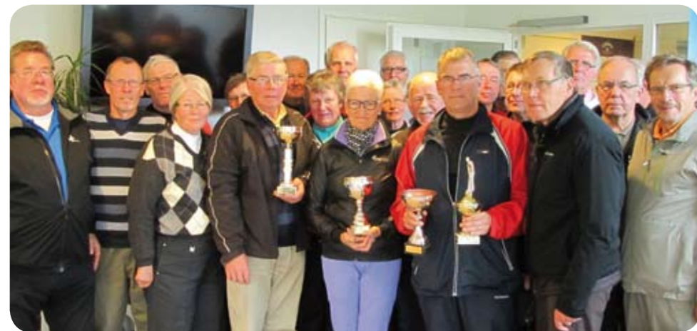
Aktiivinen seniorijoukkomme oman kauden päätöskisansa jälkeen.