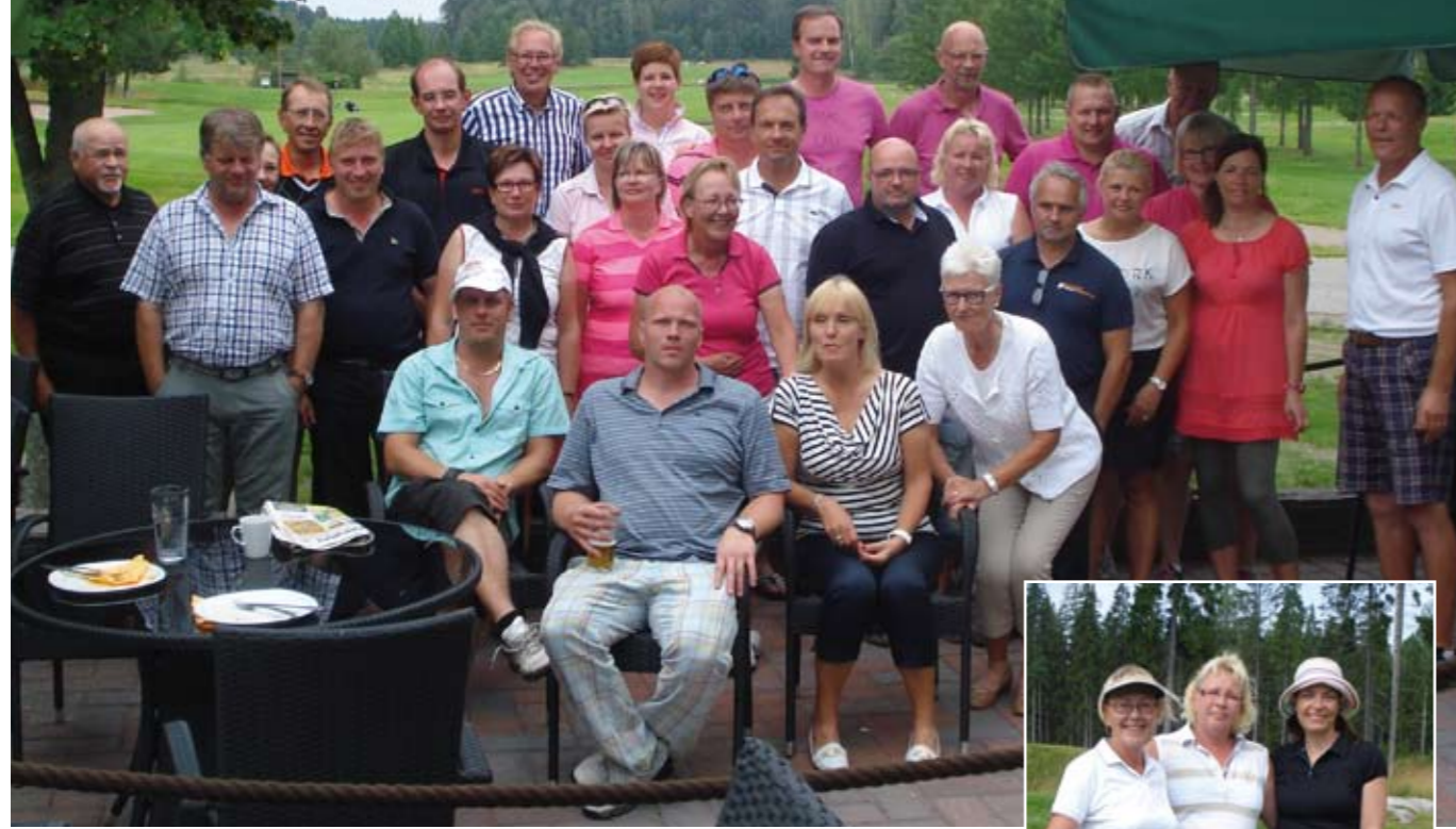
Koko reissujengi ryhmäkuvassa Koski-Golfin terassilla.

Jo tutuksi tulleeseen tapaan tänäkin vuonna järjestettiin kaksi erillistä klubimatkaa, kun heinäkuun lopussa tehtiin kahden yön mittainen peliretki Lappeenrantaan ja Kuusankoskelle ja syyskuun alussa lähdettiin päiväretkelle Uudenkaupungin Golfiin.