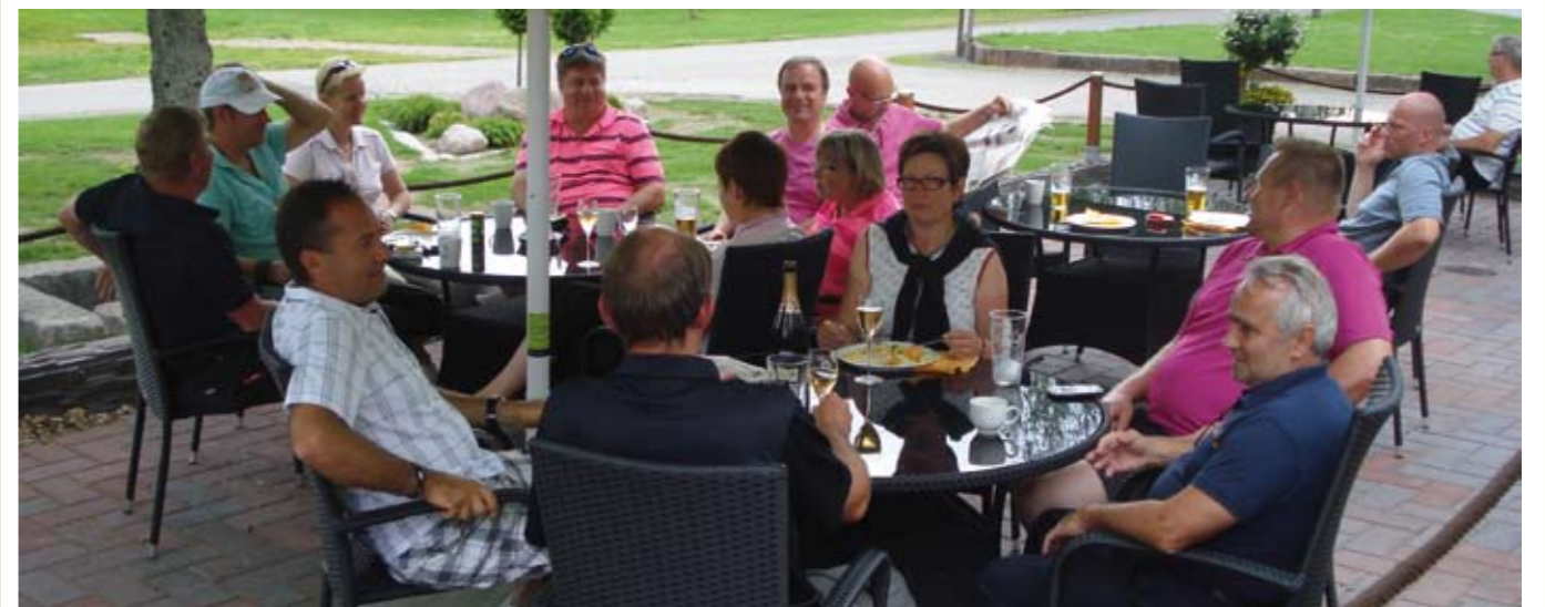
Klubimatkalaisten terassitunnelmia Koski-Golfissa.