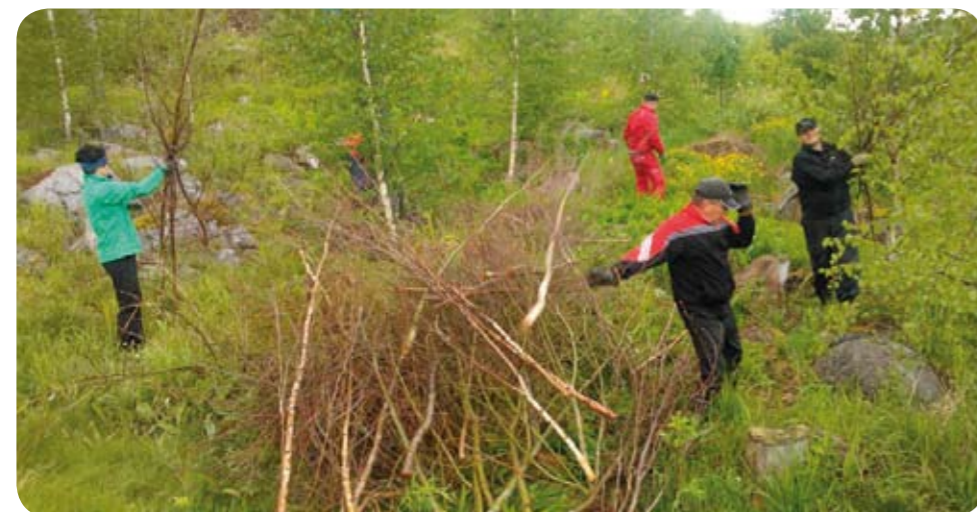
Kauden aikana talkoitiin joka kuukauden ensimmäisenä keskiviikkona. Kiitos ahkeralle talkooväelle merkittävästä panoksesta ja kentänhoitoavusta!

KÄYTTÖAUTO GREEN ON NYT TAMPEREEN GOLFHALLI - WWW.GOLFTAMPERE.FI